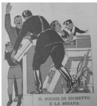
Figura n. 4. Mussolini distribuisce giocattoli ai bambini in uniforme di Figli della Lupa, di Balilla e di Piccole Italiane. Illustrazione di Pio Pullini nel Libro di lettura per la terza classe dei centri rurali. L'aratro e la spada . Libreria di Stato- Roma, 1941.

Se Marisa «lavora a fare un corpetto di lana alla sua bambola [...] Richetto lancia all'assalto i suoi soldatini. Di tanto in tanto monta su una sedia e sventola una bandierina, gridando: Viva l'Italia!» (Petrucci, 1941, p. 82).