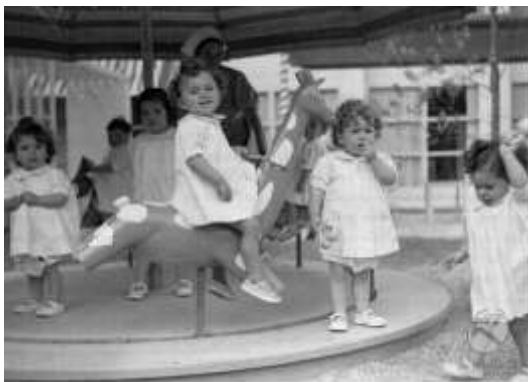
Figura n. 2. Mostra Colonie estive. Roma 19.06.1937.

Altre foto e pellicole che restituiscono l'attenzione del regime fascista per l'infanzia sono, infine, quelle dedicate a momenti di svago e di festa, quali ad esempio La Befana del Duce del 1934 o La Befana fascista del 1937, dove venivano distribuiti dei pacchi dono ai bambini dei quartieri più poveri che contenevano dei messaggi, ritratti del Duce, frasi di elogio del regime, poesie dedicate al Duce, dimostrando che nessuna azione rivolta all'infanzia fu lasciata al caso durante il ventennio fascista e che per raggiungere i bambini e le bambine occorreva in primo luogo occuparsi delle loro famiglie.