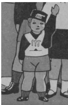
Figura n. 3. Illustrazione di Pio Pullini nel Libro di lettura per la terza classe dei centri rurali. L'aratro e la spada. Libreria di stato-Roma, 1941.

Non c'è bambino, si può dire, col musetto ancora imbrodolato di latte materno, che non aspiri ad indossare la camicia nera, a marciare in cadenza con un manipolo di Balilla, ad abbracciare e adoperare un moschetto (Petrucci, 1941, p. 65).