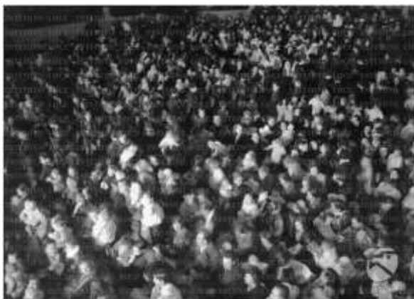
Figura n. 1. Celebrazione al teatro Adriano di Roma della Giornata della Madre e del Fanciullo. Roma 22.12.1936.

Rappresentativi sono a tal proposito i filmati dedicati alla Celebrazione della giornata della madre e del fanciullo : ad esempio il video sonoro del 30 dicembre del 1934 dal titolo Celebrazione romana della giornata della madre e del fanciullo ( https://patrimonio.archivio-luce.com ) ritrae numerose mamme, convocate in quanto “madri prolifiche”, che vengono premiate presso il teatro Adriano dalla principessa Maria di Savoia con i loro bambini, gli “ultimi nati”, sia per la “natalità” che per “l'allevamento”, termine quest'ultimo che lasciava intendere che la cura educativa dei bambini della prima infanzia dovesse essere rivolta in primo luogo al loro benessere fisico. Venivano inoltre elargite alle madri le borse prescolastiche “Maria Pia di Savoia” in favore della missione da svolgere presso gli asili infantili, circostanza che testimonia il crescente interesse del regime per l'educazione dei bambini più piccoli.